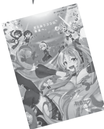
Art by クスノキ ©Crypton Future Media,INC. www.piapro.net DIADFG

令和2年度目標額 3,600,000円 (八雲地域 3,000,000円 熊石地域600,000円)