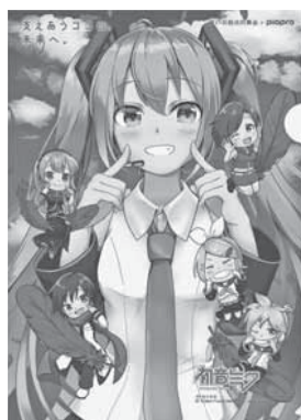
Art by イルカ ©Crypton Future Media,INC. www.piapro.net DIADFG