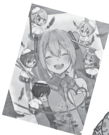
Art by 朝顔みのる ©Crypton Future Media,INC. www.piapro.net DIADFG