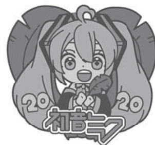
Art by 白雲とわ ©Crypton Future Media,INC. www.piapro.net DIADFG